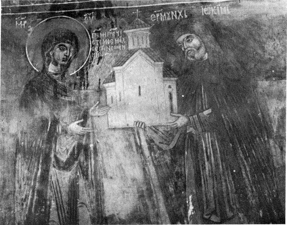
Сл. 1. — Јеромонах Јоаким ктитор ман. Пустиња подноси Богородици на дар своју задужбину са речима: „Прими Пречиста на дар моје мало приношение“.