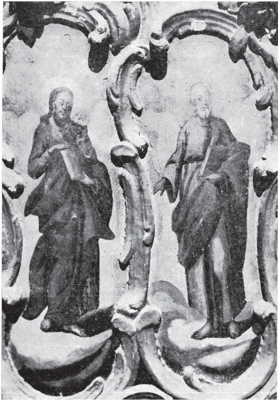
Сл. 5. — Теодор Крачун, апостоли, Добринци