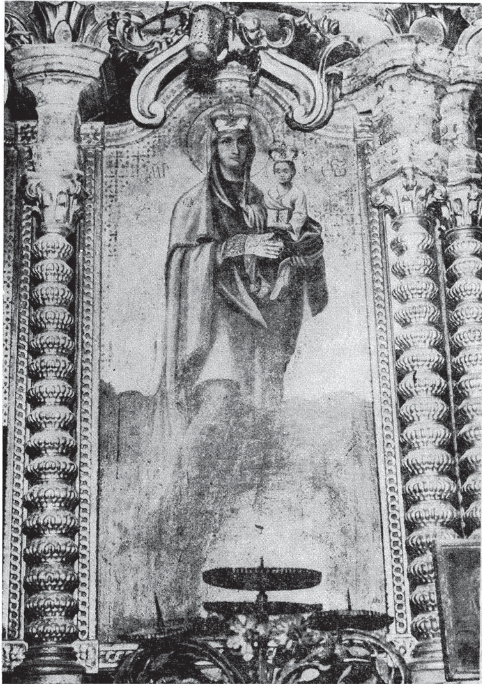
Сл. 8. — Богородица са Христом, Успенска црква у Иригу