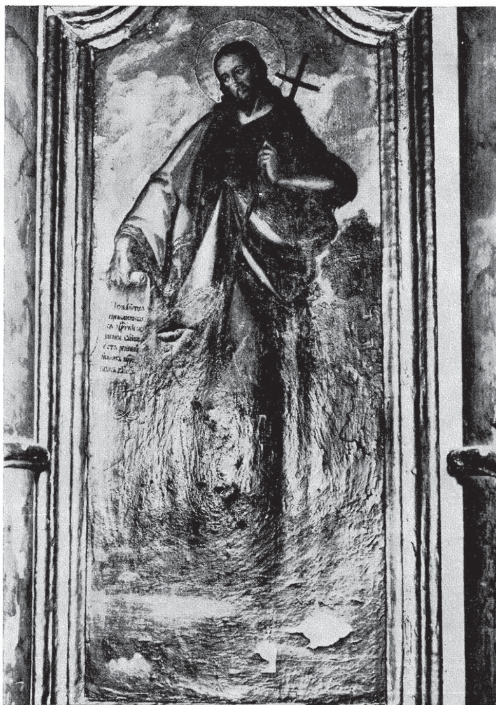
Сл. 4. — Теодор Крачун, престо̀на икона св. Јована, Добринци