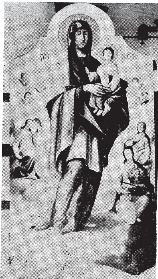
Сл. 9. — Теодор Крачун, Богородица са Христом из цркве манастира Новог Хопова