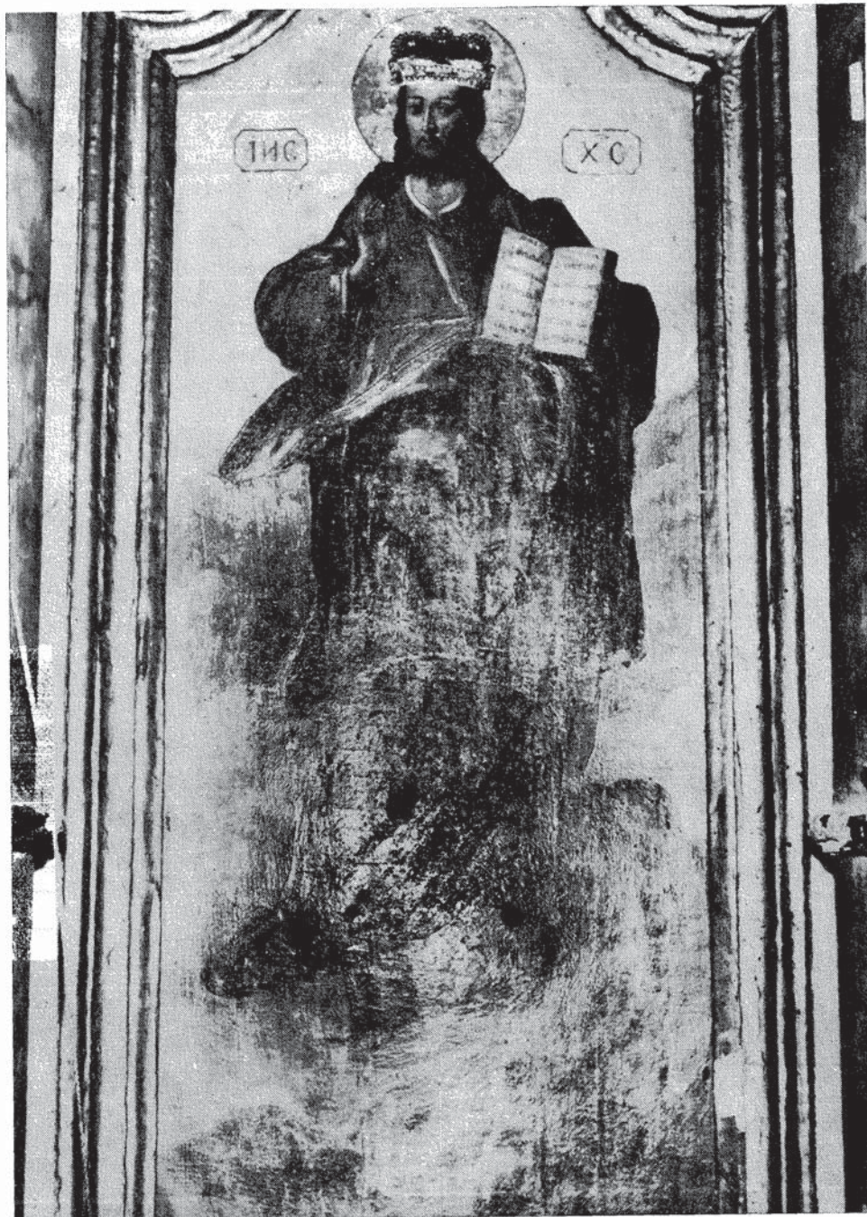
Сл. 2. — Теодор Крачун, престопа икона Христа, Добринци