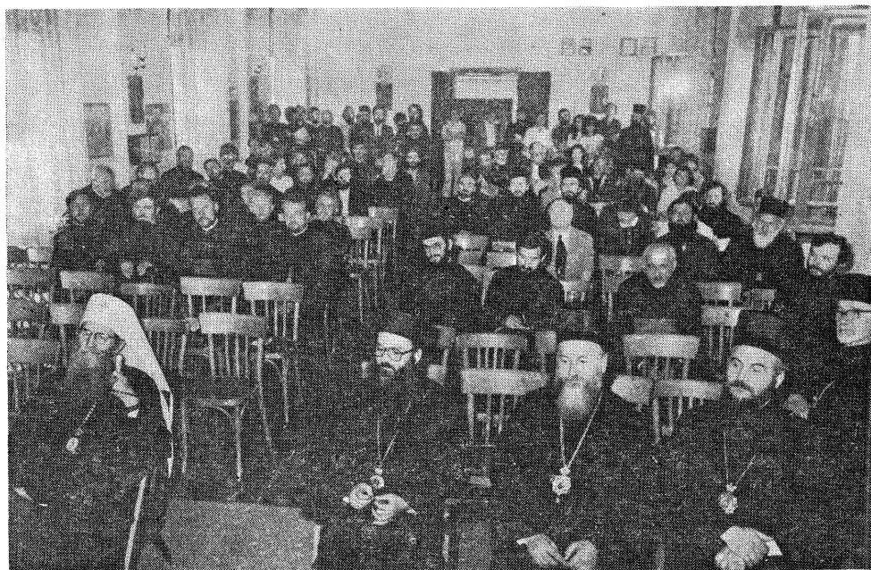
Са II Симпозиона теолога у сали Српске Патријаршије