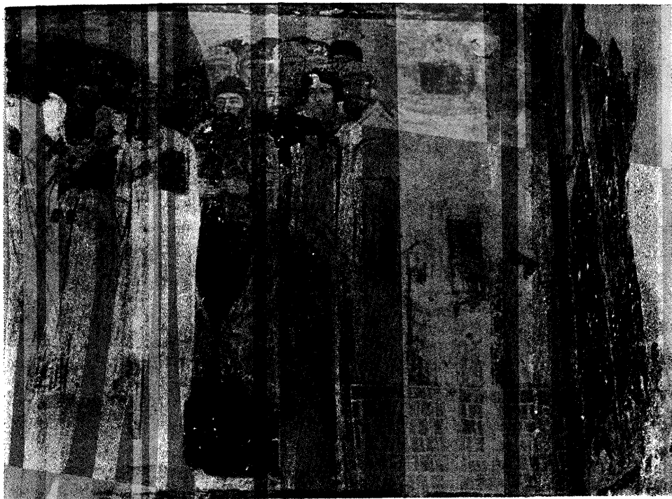
Приказ манастира Студенице на фресци у јужној капели Радослављево припрате из четврте деценије XIII века

(сл. 7), кула је приказана са зупцима по ободу, што би говорило да је имала одбрамбену намену. Сличне високе куле — на местима одакле је била најбоља прегледност — постоје и у другим монашким насеобинама, као у Хиландару на пример. Изгледало је, стога, да су првобитне куле биле или оштећене или недовољно високе и да је једна од те две околности подстакла изградњу нове веће висине. У склопу овог питања неопходно је, међутим, истаћи и оне околности које би говориле да су за одлуку о градњи куле у Студеници могли бити пресуднији литургијски разлози. Та је кула, наиме, смештена тачно у осовини цркве, на западној страни као средњовековни звоници, па постоји могућност да је у трећој деценији XIII столећа — када је грађена спољна припрата са звоником уз жичку цркву — донета одлука да се подигне не само студенички ексонартекс, већ и један звоник, и да је он смештен изнад улаза. Та мисао има оправдања и зато што изгледа да је та кула имала на последњем спрату простран, вероватно, дводелан прозор као средњовековни звоници, што би се смело претпоставити по великом накнадно попуњеном оштећењу у средини западног зидног платна куле, на одговарајућој висини. Најзад, у прилог претпоставке да је правоугаона кула служила као звоник говорио би и садржај приказа у капели на спрату, јер по њима изгледа да је капела била посвећена