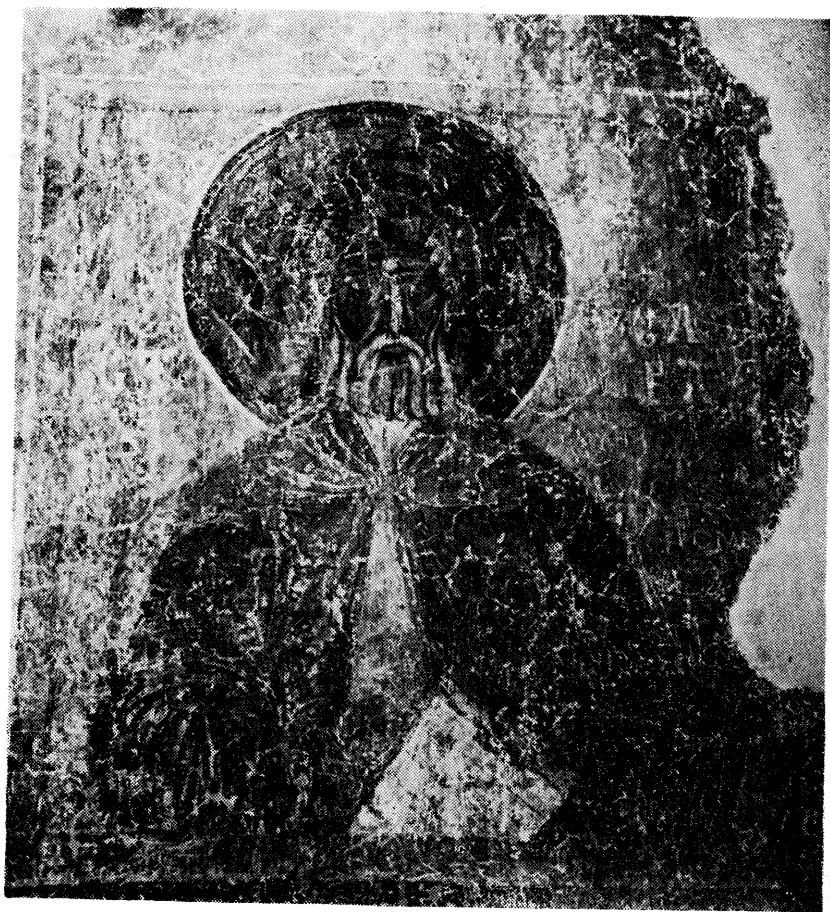
8. Жича, Свети Сава Јерусалимски, после 1220.