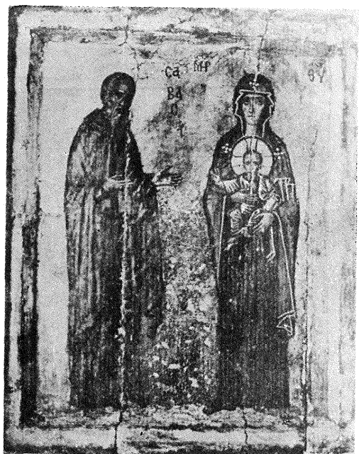
3. Студеница, Богородица „Студеничка“, 1208/9.