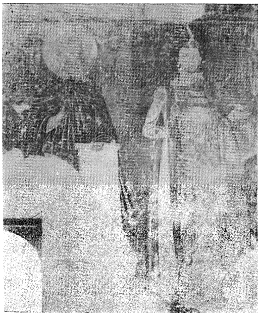
7. Милешева, Свети Сава Је- русалимски и ктитор Вла- дислав, 1221—1228.