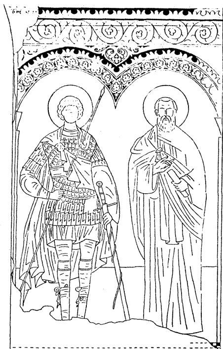
5. Жича, Свети Борђе и Свети Сава Јерусалимски, 1309 — 1316. (цртеж Б. Живковића).