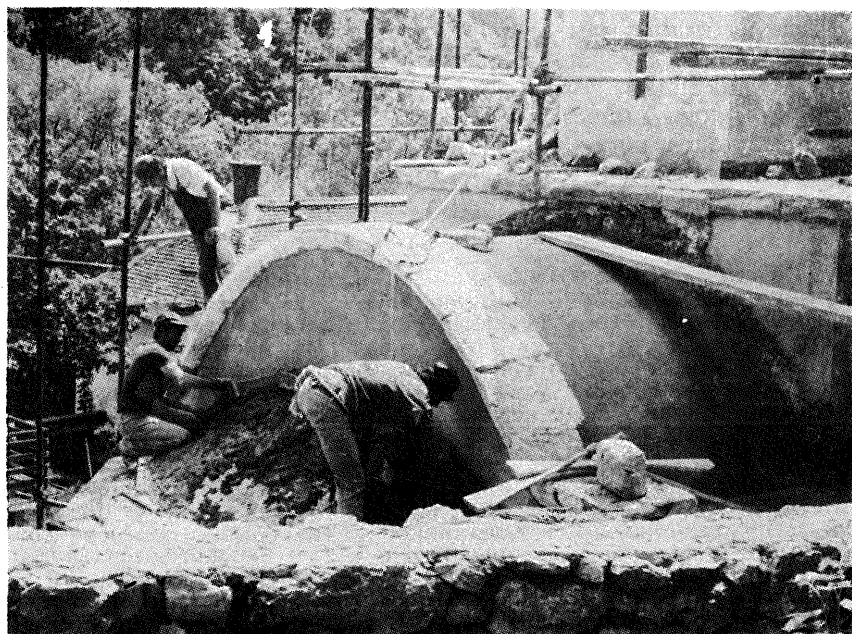
Слика 1. и 2.

Манастир Горњак у истоименој клисури, на левој обали реке Млаве. Изглед кубета и најновија откопавања.