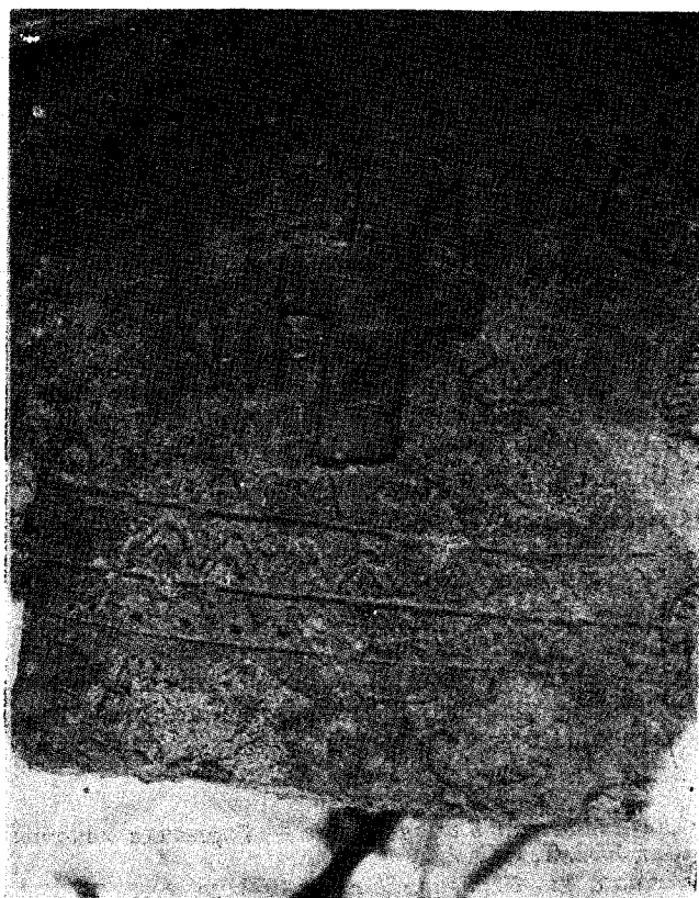
Слика 3. и 4.: Пронађени фрагменти и надгробна плоча.