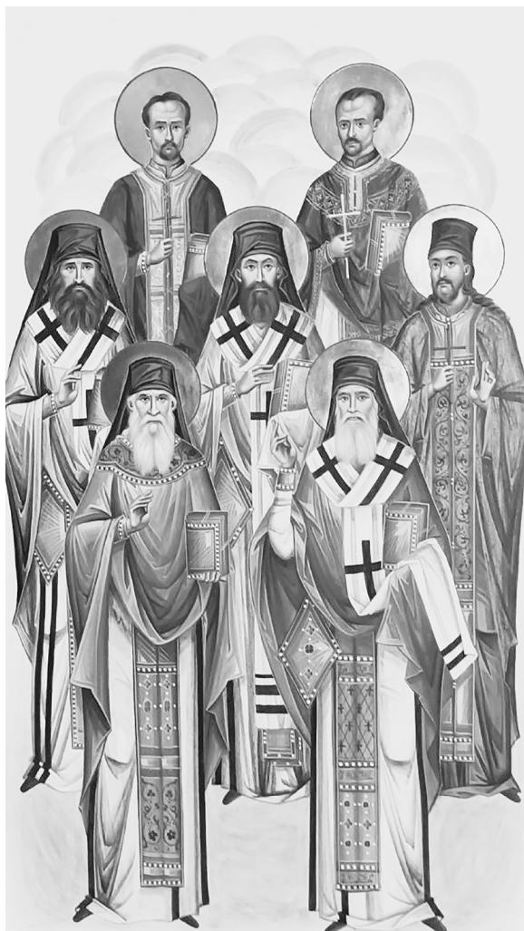
Сл. 2. Свети који су учили и који су се учили на Богословском училишту у Београду, икона, рад Веронике Ђукановић

Новоустановљени спомен Светих који су учили и који су се учили на Богословском училишту у Београду одговара типу саборних, заједничких спомена, односно спомена који обједињују свете једне групе (Сабор Светих праотаца, Сабор дванаесторице или седамдесеторице Светих апостола, Света три јерарха, Свети Атанасије и Кирило, Свети српски просветитељи и учитељи и други) или једне територије (примера ради, свака помесна Црква у другу недељу по Педесетници прославља саборни спомен својих светих). Почетком XXI века постојање саборних спомена посведочено је и у случају неких богословских училишта Руске Православне Цркве. О томе најбоље сведочи постојање Сабора Светих Кијевске духовне академије и семинарије. Уобличавање тог спомена текло је постепено. Најпре је 2012. године насликана икона светих и установљен богослужбени дан (27. октобар / 9. новембар). Потом је